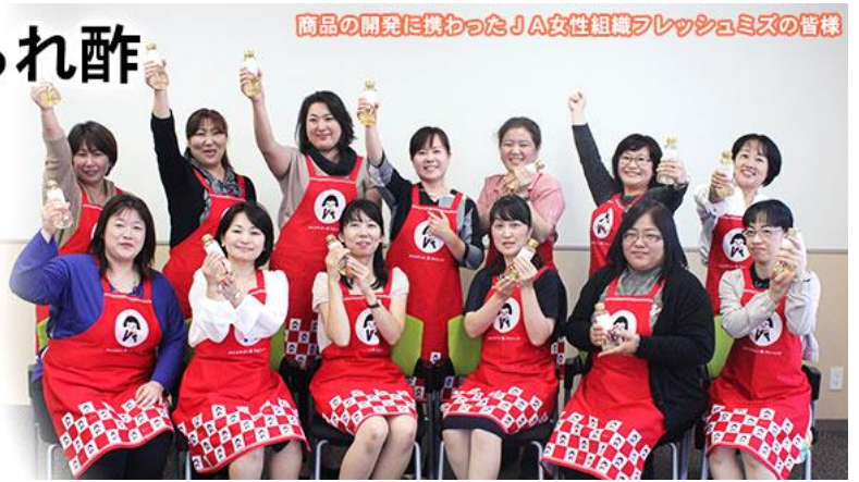
商品の開発に携わったJ A女性組織フレッシュミズの皆様