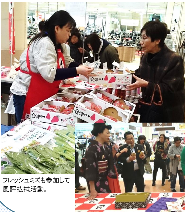
フレッシュミズも参加して風評払拭活動。

販売コーナーでは、イチゴやトマト、うりい、オータムポエムなどの生鮮品に加えあんぼ柿などの加工品を販売して、福島県の農産物をPR・風評払拭活動を行いました。お笑いの母心も駆けつけ、PRに一役買いました。(写真右下)